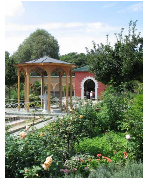
Eingang zum Saal vom Orientalischen Garten