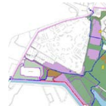
BEP Mitte, Fachplan Grün- und Freiflächen, Festplatz

Erwartet werden Gestaltungsvorschläge für die naturnahe Parkanlage (Wälle und Grünfläche am Kurt-Schumacher-Damm, Lagerplatz), die einerseits den Ansprüchen des Naturschutzes gerecht werden, andererseits eine behutsame Nutzung der Flächen vorsehen (inkl. Zonierung, Ausstattung, Wegesystem, Aufenthaltsqualitäten; Vegetationsstrukturen).