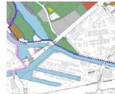
BEP – Berlin Mitte, Eckernförder Platz

Gegenstand der Vertiefung in diesem Stadtraum sind Vorschläge für eine bessere Verknüpfung des Eckernförder Platzes mit dem angrenzenden Stadtraum und die Überwindung der verkehrlichen Barrieren im Rahmen des Gestaltungskonzepts, das für den Grünzug erarbeitet wurde. Dabei ist das „Wäldchen“ zu erhalten und ggf. gestalterisch in das eigene Planungskonzept zu integrieren.