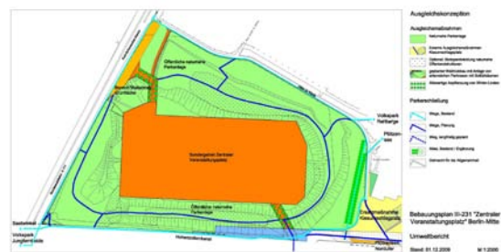
B-Plan III 231 – Ausgleichskonzeption

Der Veranstaltungsplatz mit einer Größe von ca. 8 Hektar wird an drei Seiten von Erdwällen gesäumt, die noch aus der Zeit der militärischen Nutzungen stammen. Die Wälle und die umgebenden Grünflächen sollen im Zuge des B-Plan-Verfahrens III-231 als naturnahe Parkanlage festgesetzt werden. Die dabei verfolgten Ziele sind u.a. die Verbindung der Erdwälle mit den vorhandenen Grünflächen des Festplatzes sowie Verknüpfung mit Parkanlagen in der unmittelbaren Nähe (Rehberge, Jungfernhede, Grünflächen am Hohenzollernkanal). In dieses künftige Verbundsystem sollen auch die wohnungsnahen Freiflächen der benachbarten Bebauung und der östlich angrenzende Lagerplatz integriert werden.