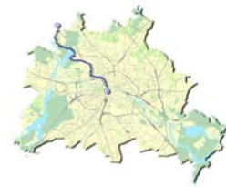
Grüner Hauptweg Nr. 3

Beispielsweise verläuft der Grünzug in Teilen auf dem dritten der „20 Grünen Hauptwege“ Berlins, dem „Heiligenseer Weg“, der vom Regierungsviertel über Berlin-Heiligensee bis ins brandenburgische Umland zum Naturpark Barnim führt. Etwas südlich vom Nordhafen stößt der „Berliner Mauerweg“ auf den Grünzug. Außerdem wird die überregionale Radwegeverbindung Berlin-Kopenhagen über den Grünzug geführt.